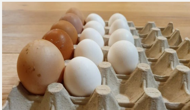
Není vejce jako vejce.

Těsto na ně připravíme vždy ze tří základních ingrediencí . Mouky, v našem případě Červené směsi PASTA & GNOCCHI , vajec a špetky soli . Málokterý druh pokrmu je tak nenáročný na suroviny. Červená směs je na bezlepkové těstoviny perfektní, proto jsme jejich italský název „PASTA“ vtělili i do samotného označení směsi. Co se týče vajec, tady musíme být obezřetní, protože není vejce jako vejce. Pokud budou vejce malá, budeme muset při-