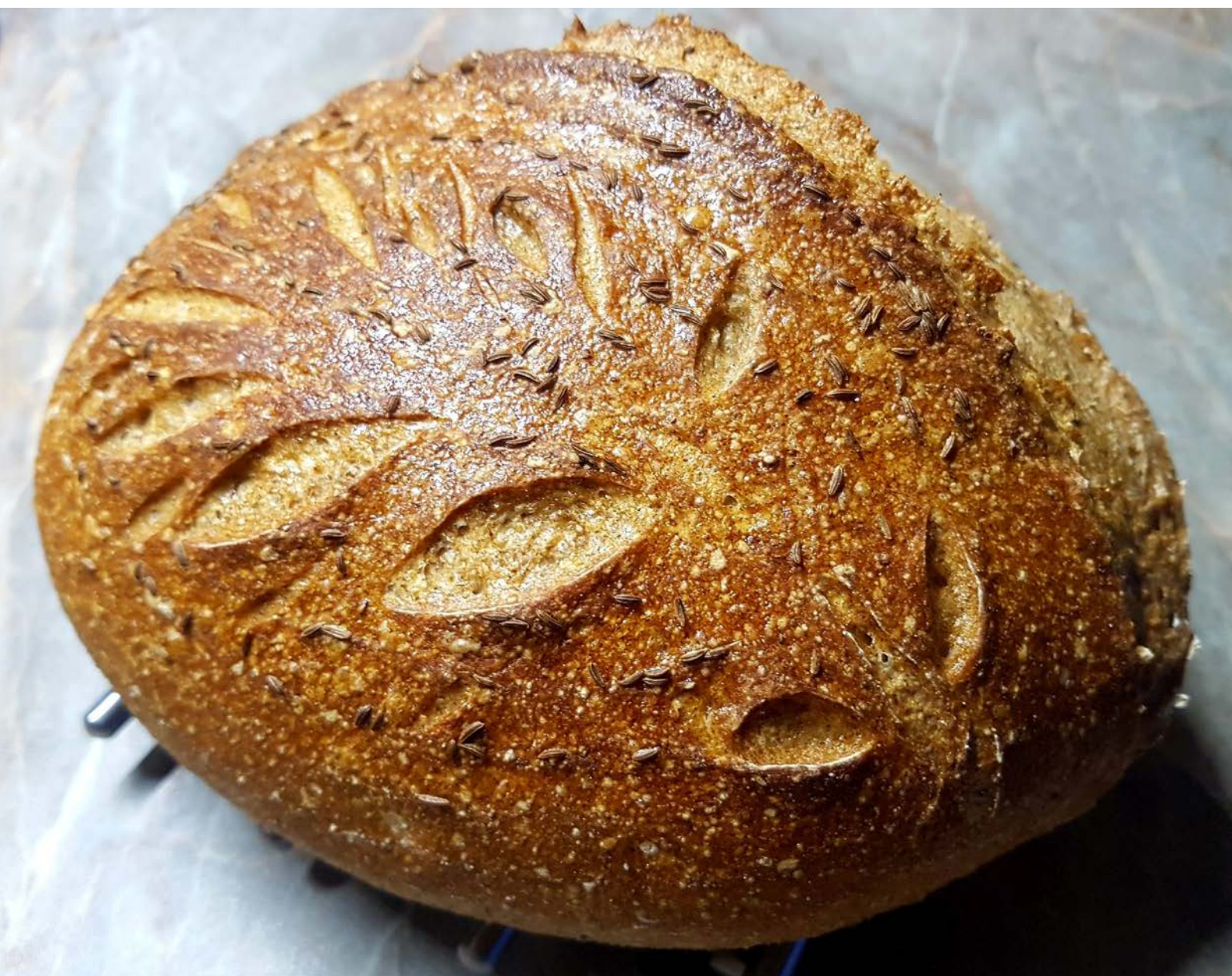
kváskový chléb