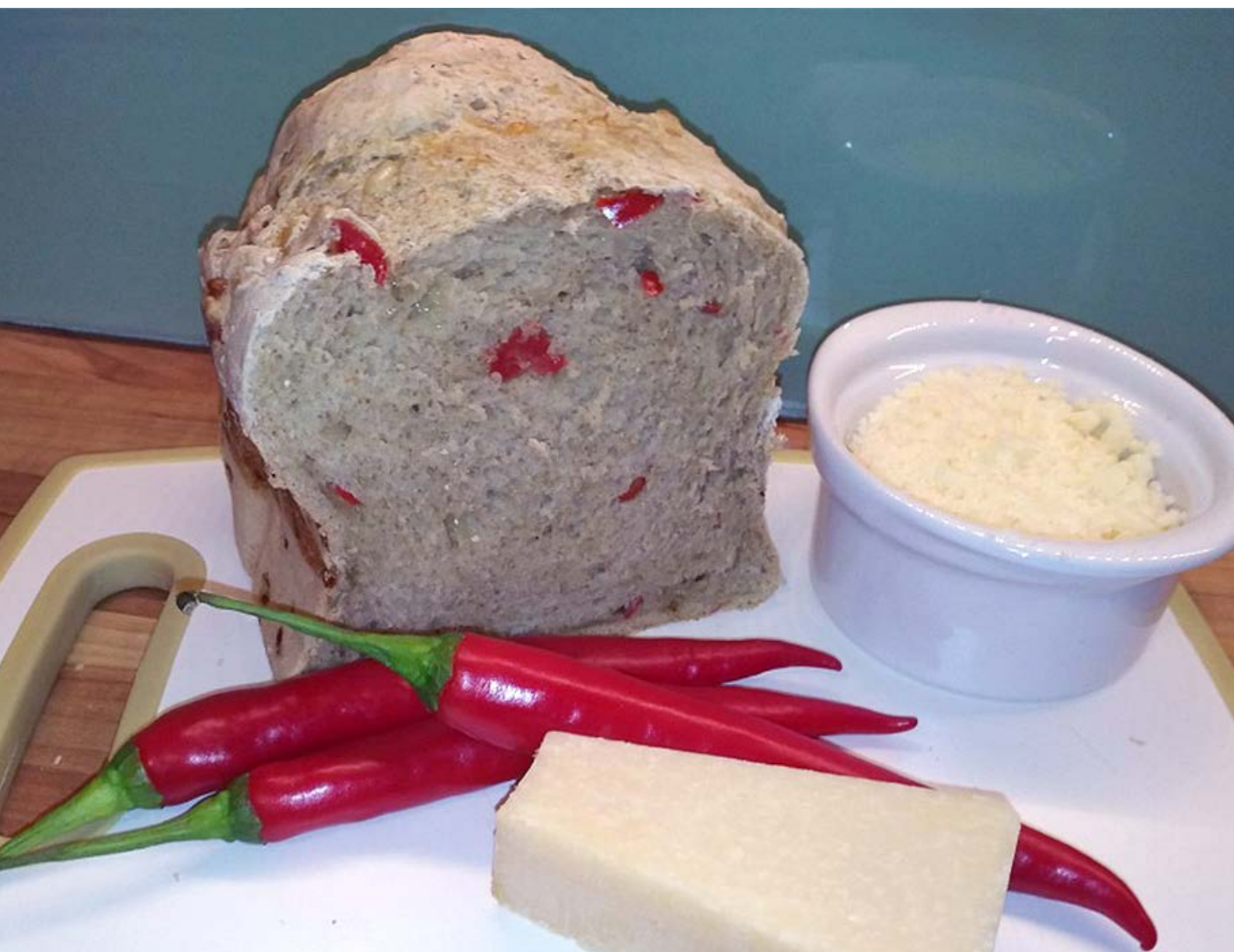
chléb pečený v domácí automatické pekárně