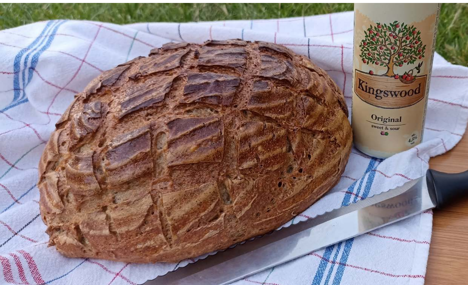
chléb pečený v klasické troubě na volno