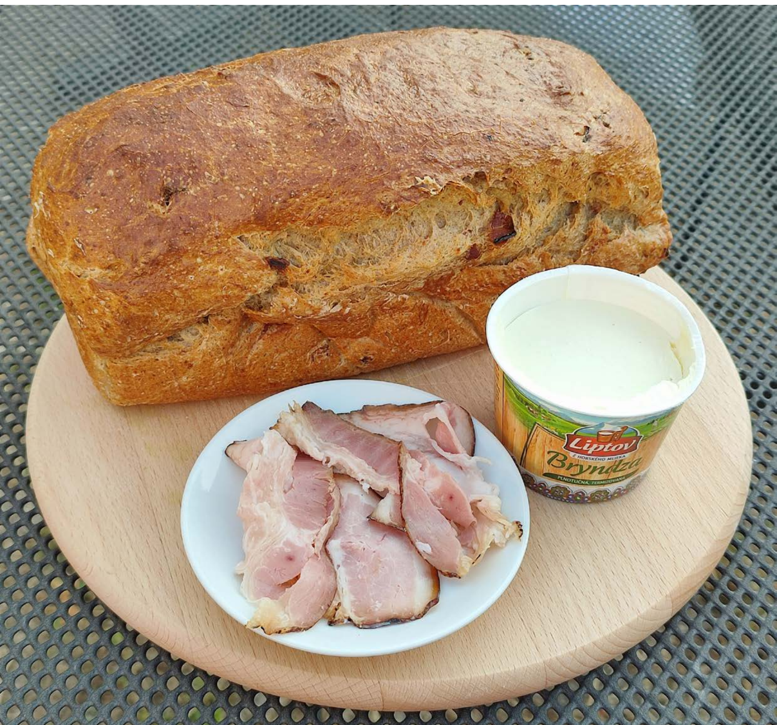
chléb pečený v klasické troubě ve formě, foto: Adveni