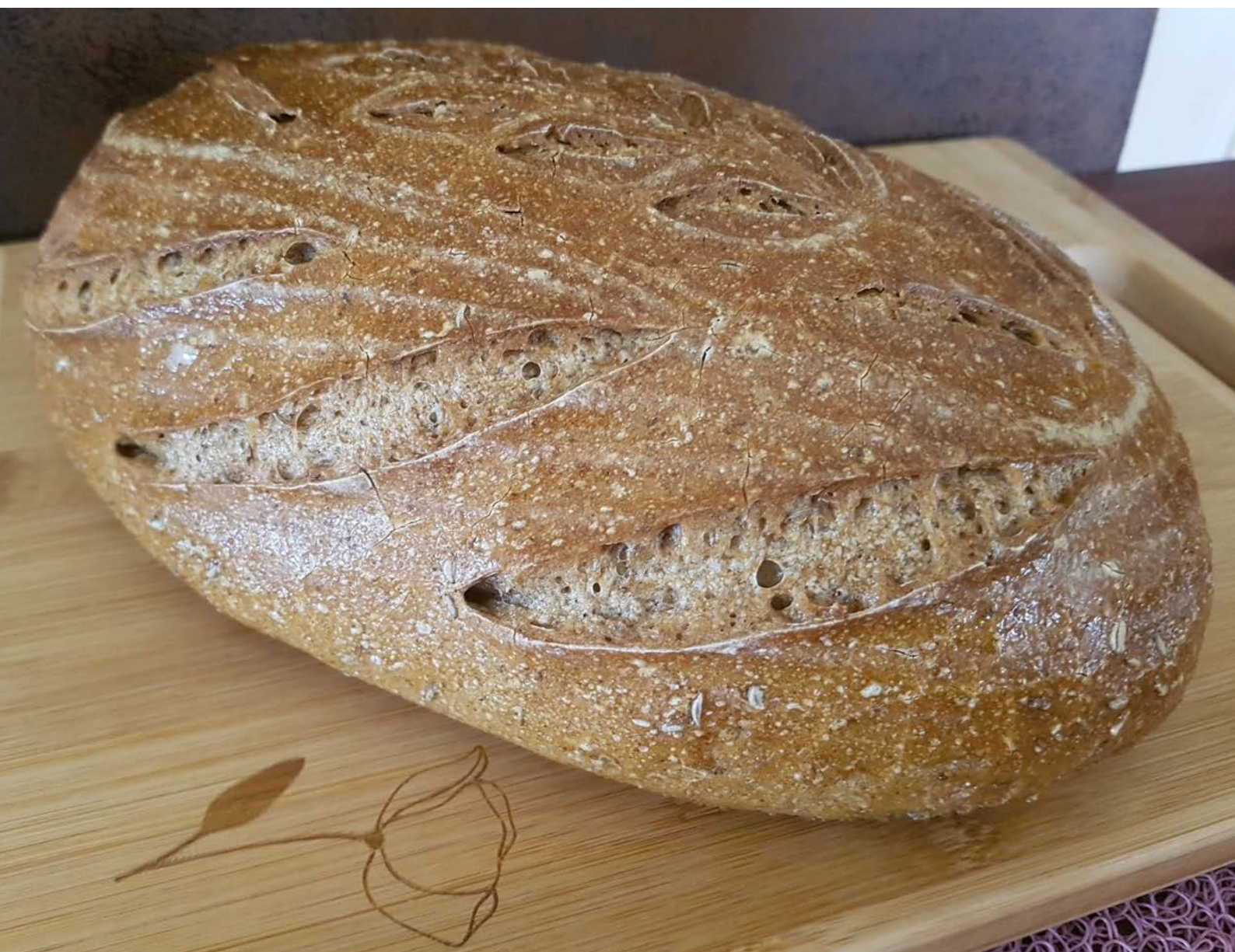
chléb pečený v klasické troubě na volno