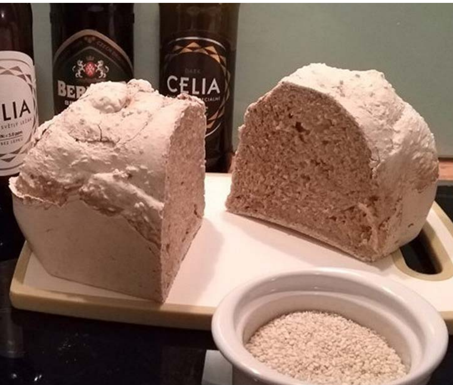
chléb pečený v domácí automatické pekárně