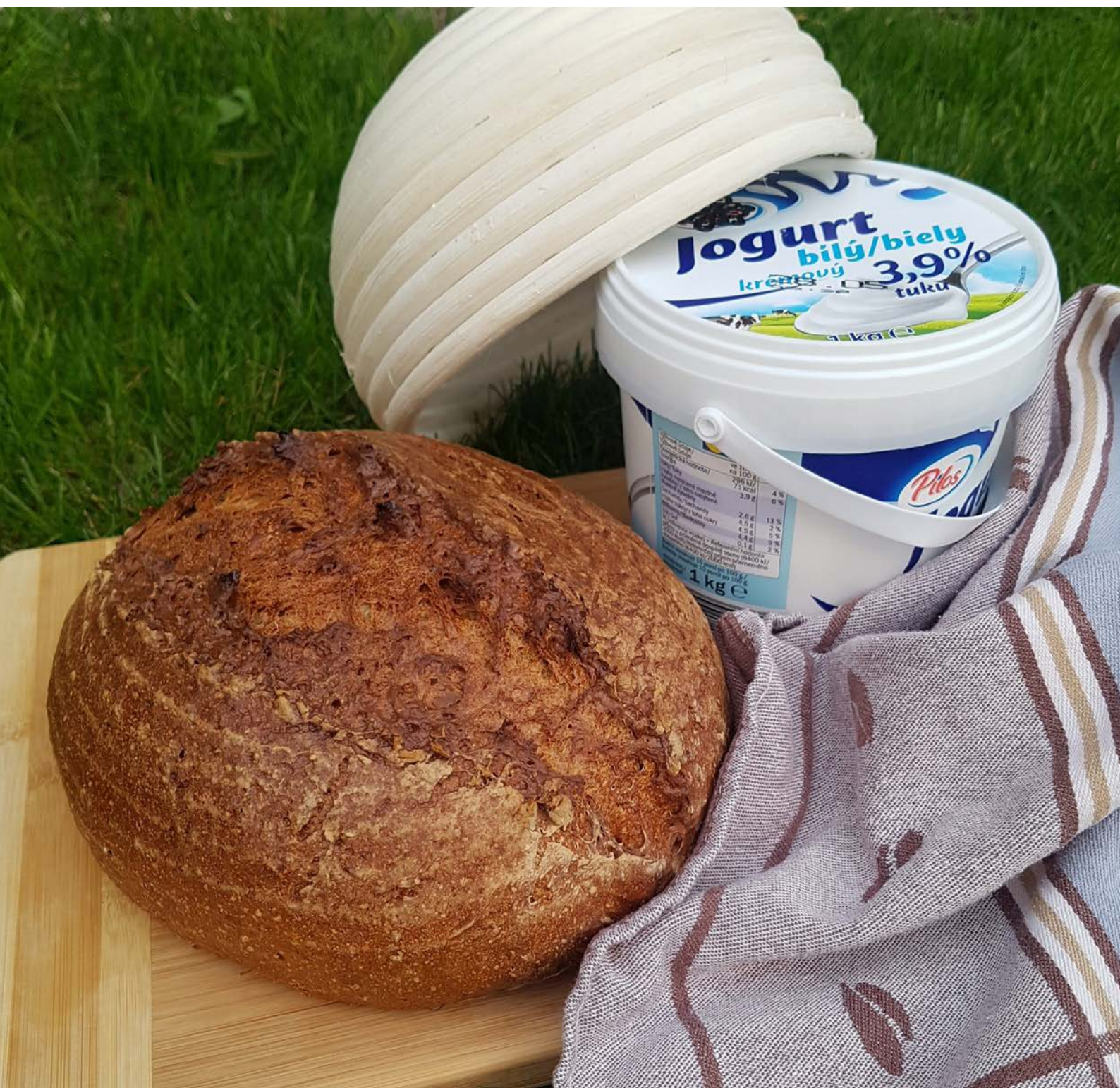
chléb pečený v klasické troubě na volno