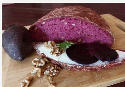
řepový s vlašskými ořechy