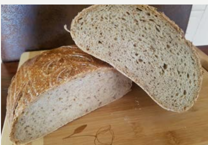
klasický typu „Šumava“