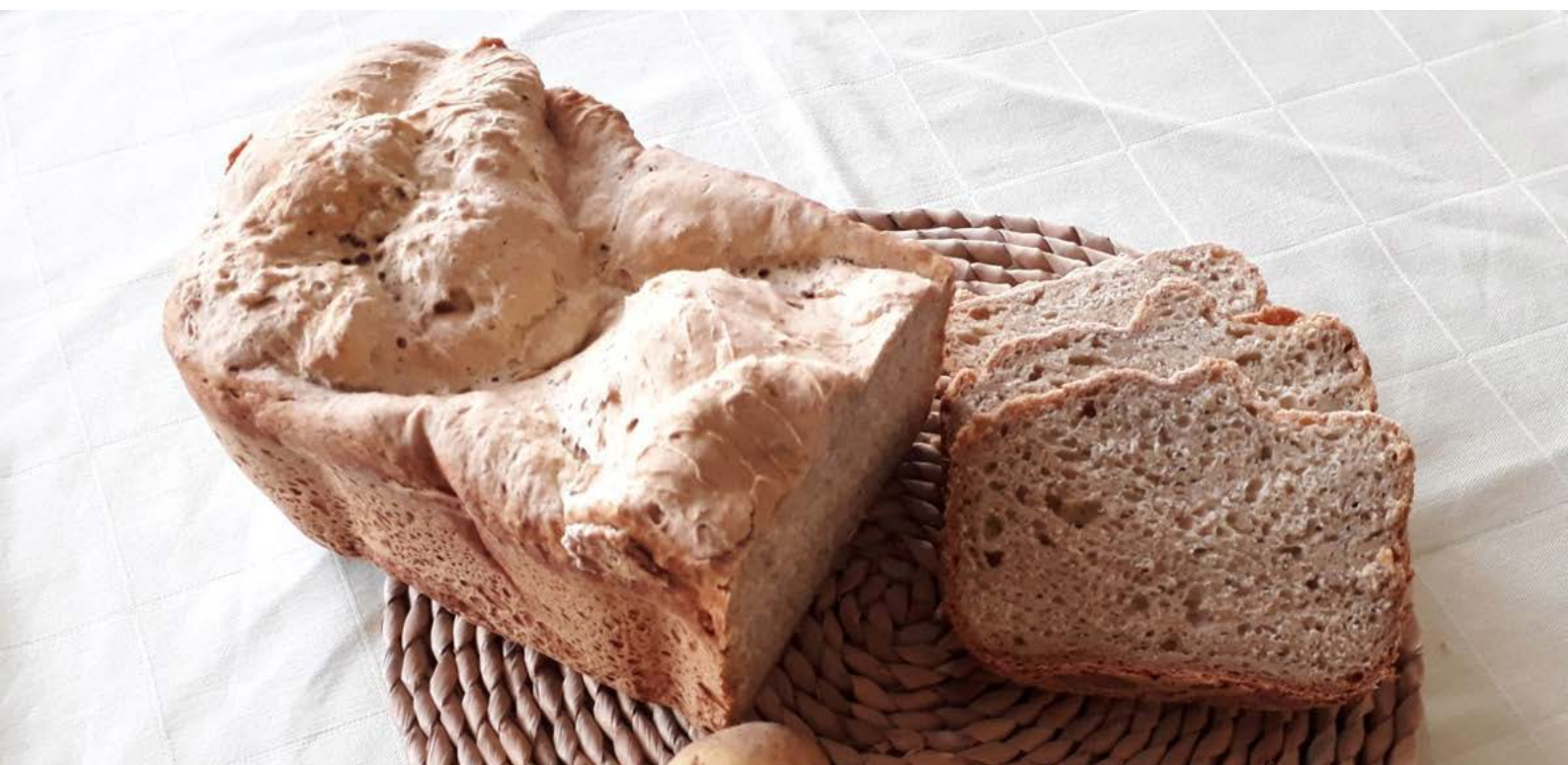
chléb pečený v domácí automatické pekárně