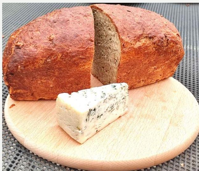
chléb s nivou pečený v klasické troubě ve formě

Toto pečení v klasické troubě je podstatně snadnější než pečení volně. Těsto zpracováváme (hněteme) pouze 1x, necháváme ho kynout pouze 1x a to přímo v nádobě, ve které budeme péct, nemusíme tudíž bochník ani tvarovat. Často se ptáte: „Skutečně necháme vykynout přímo v pečící nádobě a pak hned pečeme?“ Ano, je to tak! Tento postup byl nesčetněkrát přezkoušen a je plně funkční a zcela plnohodnotný, přestože je méně pracný než postup následující. Výsledkem je ale chléb z formy, nikoliv vlastnoručně pěkně vytvarovaný bochník.