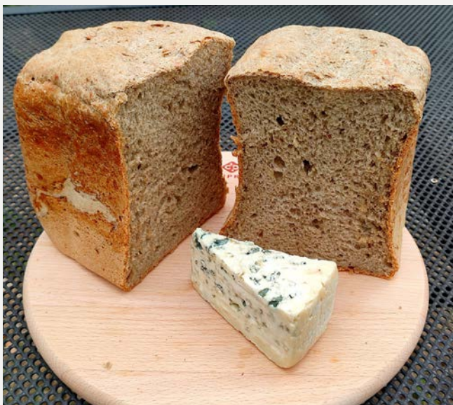
chléb s nivou pečený v domácí automatické pekárně