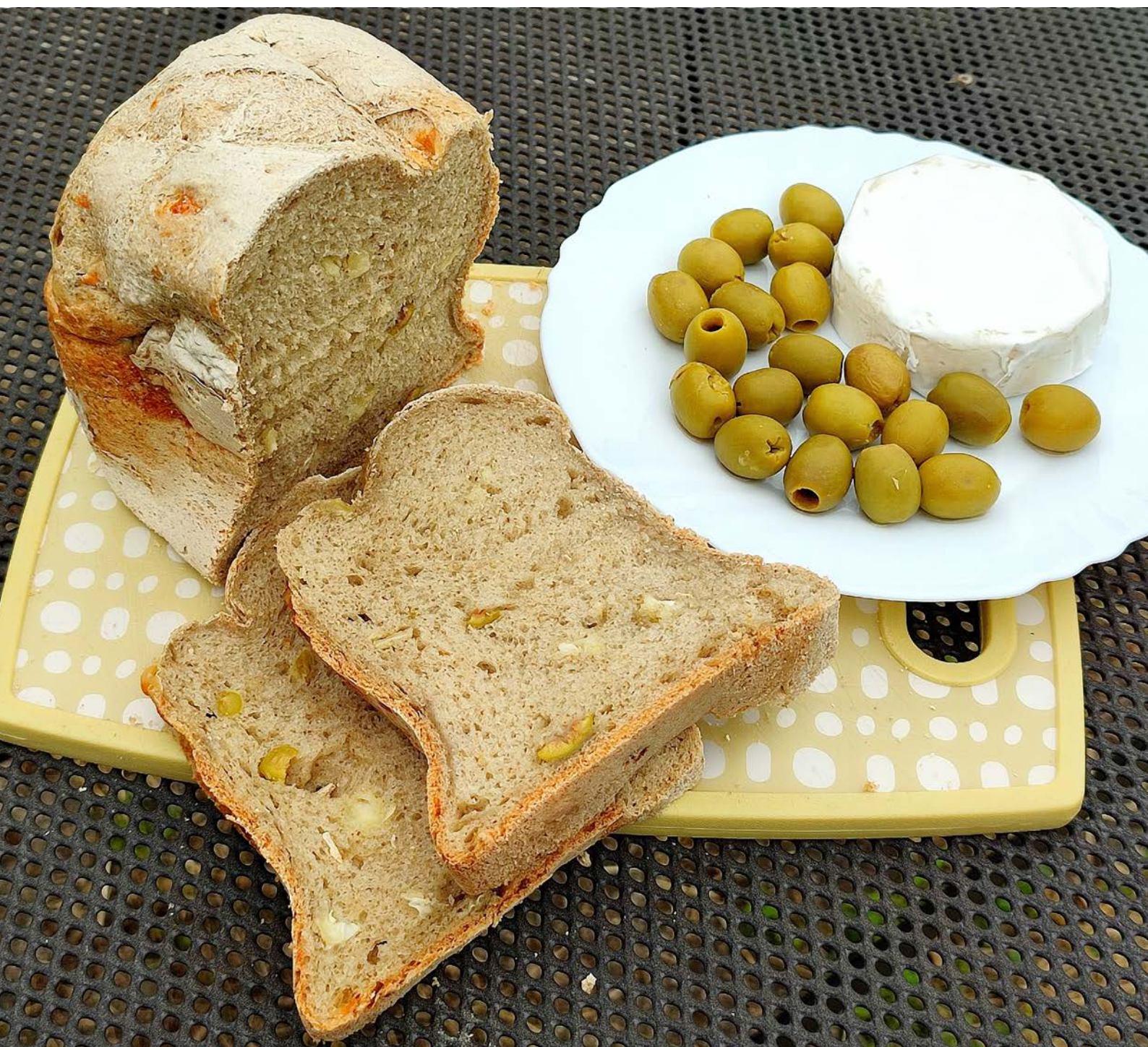
chléb pečený v domácí automatické pekárně