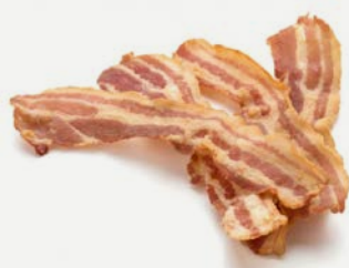
brynzový se slaninou