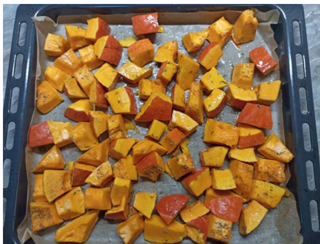
příprava dýně Hokkaidó

*Pro přípravu pyré z dýně Hokaido budeme potřebovat 1 dýni, trochu provensálského koření, oleje a vody. Dýni Hokaido zbavíme semínek, nakrájíme na větší kousky, které pokapeme olejem a posypeme provensálským kořením, a pečeme v troubě rozpálené na 200° C cca 35 minut. Upečené kousky dýně rozmixujeme s trochou vody na hladké pyré a necháme vychladnout.