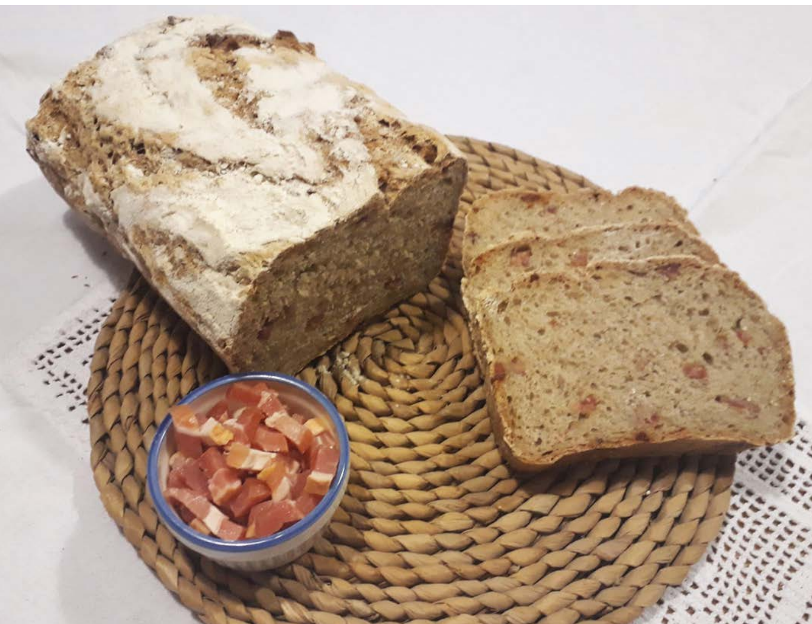
chléb pečený v klasické troubě ve formě, foto: Jana Fialková