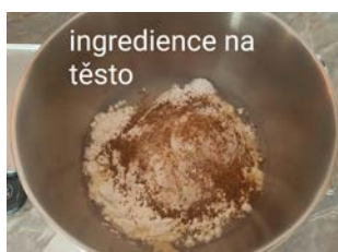
ingredience na těsto

2. Na těsto smícháme směs BREADS & BAGUETTES (tzv. MODRÁ), sůl, drcený kmín, rozkvas, vodu a olej a hněteme minimálně 5 minut do hladka, ideálně použijeme ruční hnětač nebo robot. Těsto necháme odpočívat v míse přikryté potravinářskou fólií cca 3-5 hodin. Rozhodující pro správné vykynuté těsto je okolní teplota, takže uvedený čas je jen orientační. Těsto musí minimálně o 2/3 zvětšit svůj objem a při lehkém dotyku na povrchu téměř nelepi.