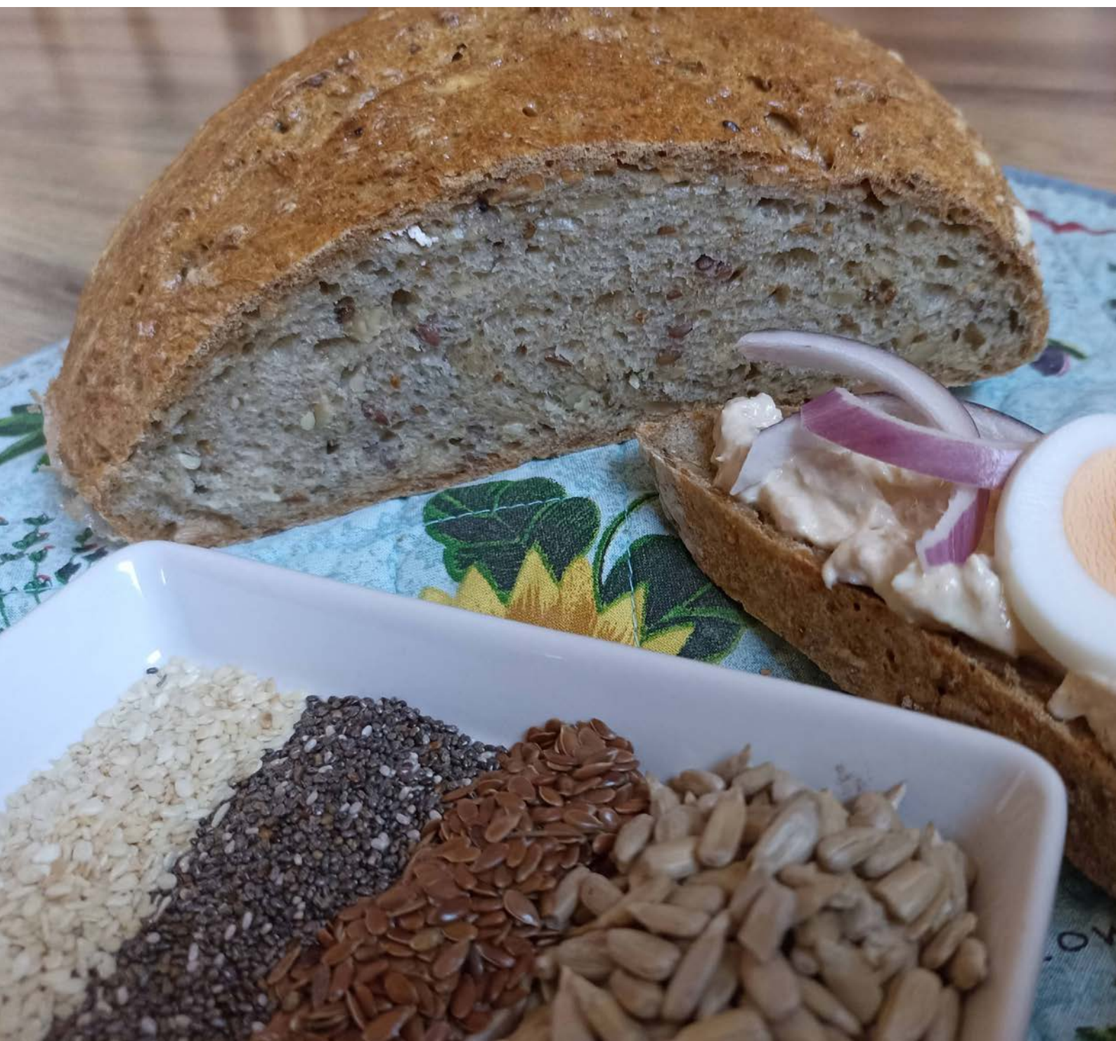
chléb pečený v klasické troubě na volno