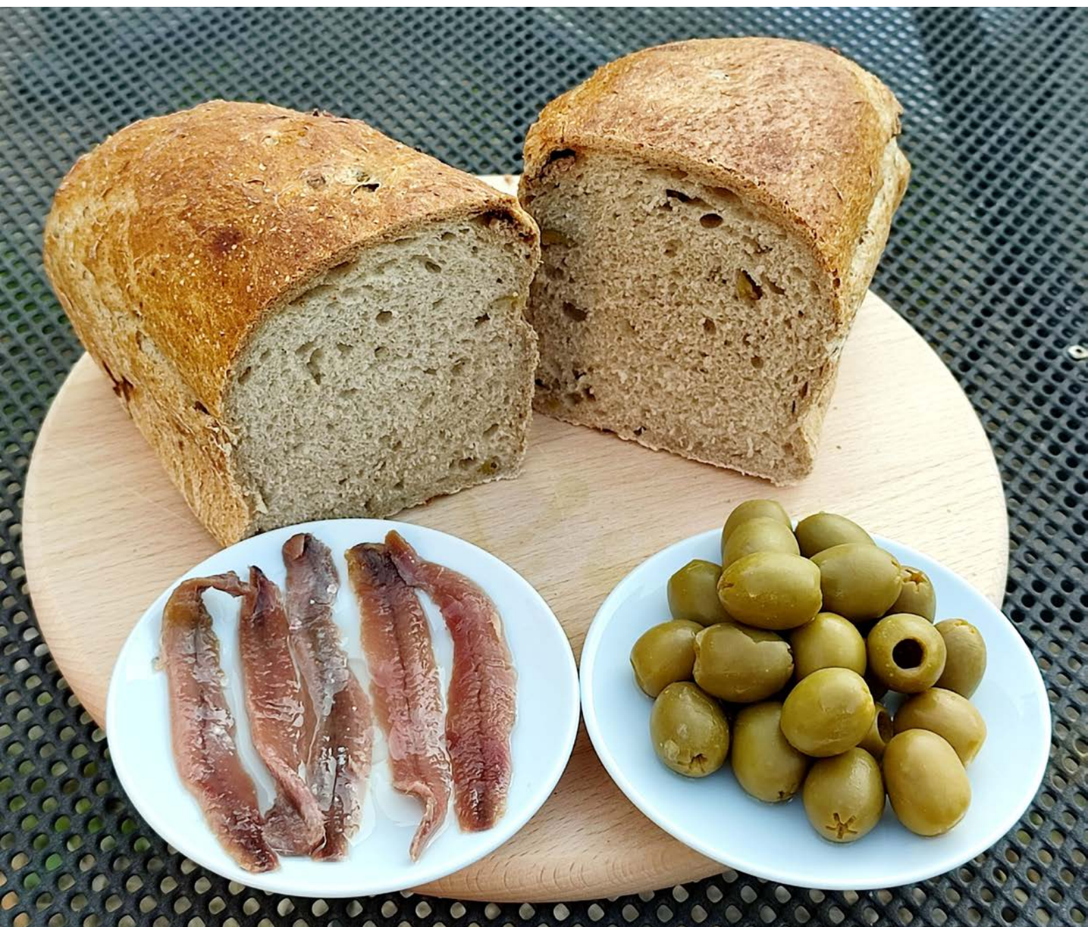
chléb pečený v klasické troubě ve formě, foto: Adveni