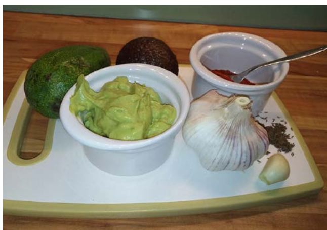
ingredience na avokádový chléb