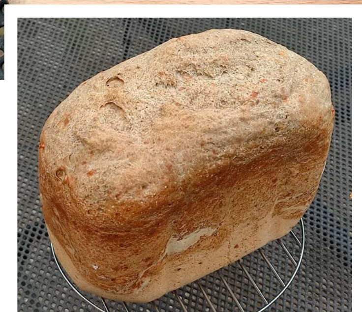
chléb pečený v domácí automatické pekárně