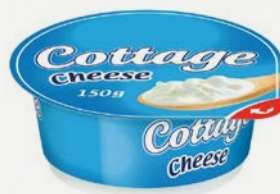
sýrový se sýrem typu Cottage