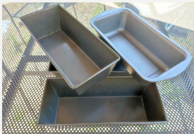
formy na pečení chleba v klasické troubě

devizou je ale pěkná, křupavá, zlatohnědá kůrka, kterou pečením v klasické troubě docílíme. Při přípravě chleba v klasické troubě se nám osvědčilo pečení s čerstvým droždím. Stejně tak je ale možné nechat kvásek vzejít z droždí sušeného. Pak namísto 21 g (tj. půlky kostky) čerstvého droždí použijte 7 g sušeného droždí.