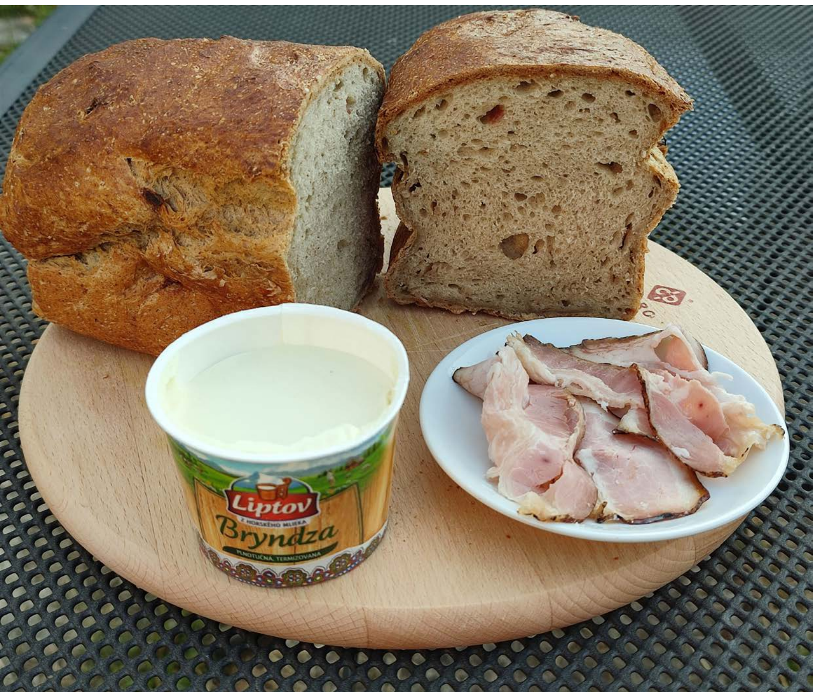
chléb pečený v klasické troube ve formě