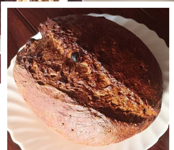
chléb pečený v klasické troubě na volno