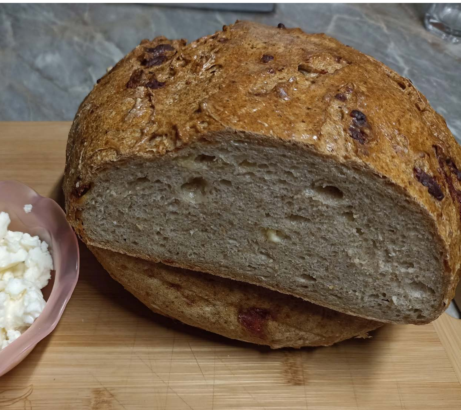
chléb pečený v klasické troubě na volno