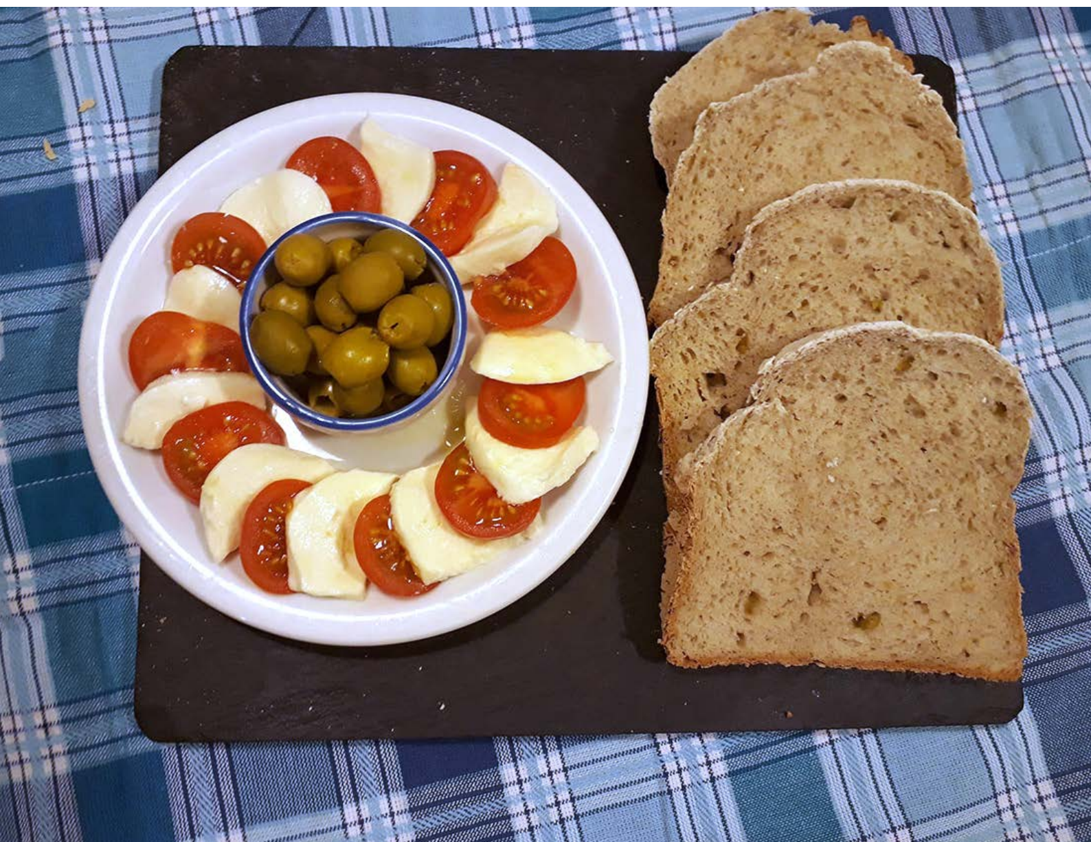
chléb pečený v domácí automatické pekárně