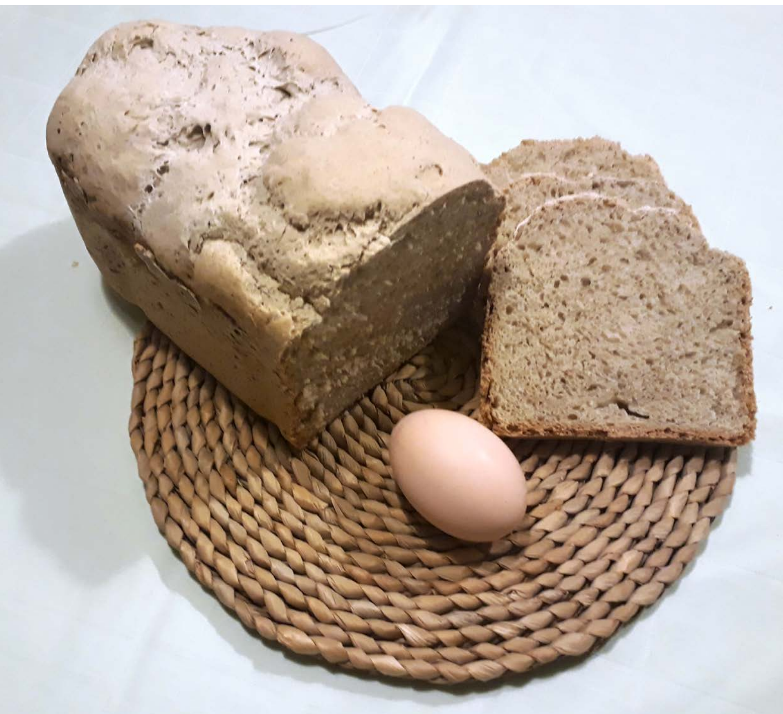
chléb pečený v domácí automatické pekárně