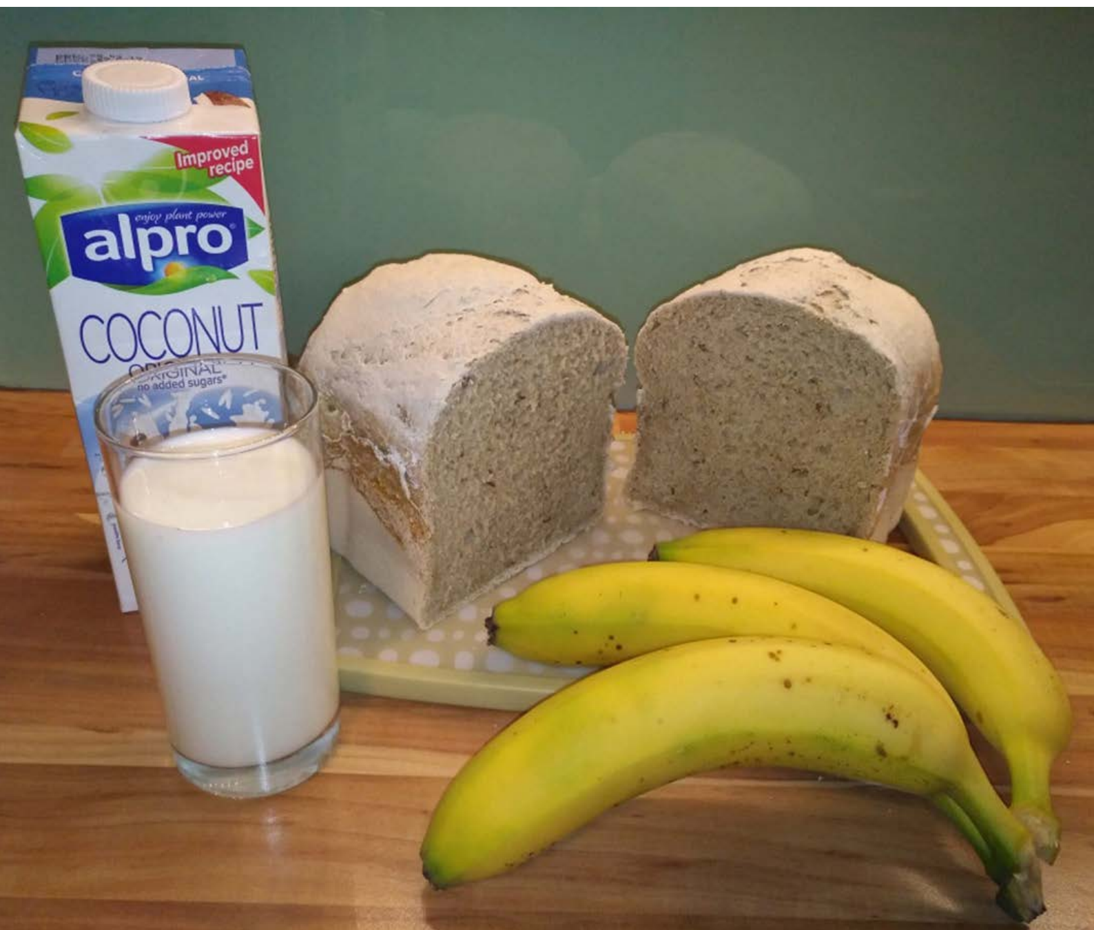
chléb pečený v domácí automatické pekárně