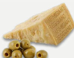
s olivami, parmez. a oreganem