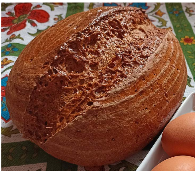
chléb pečený v klasické troubě na volno