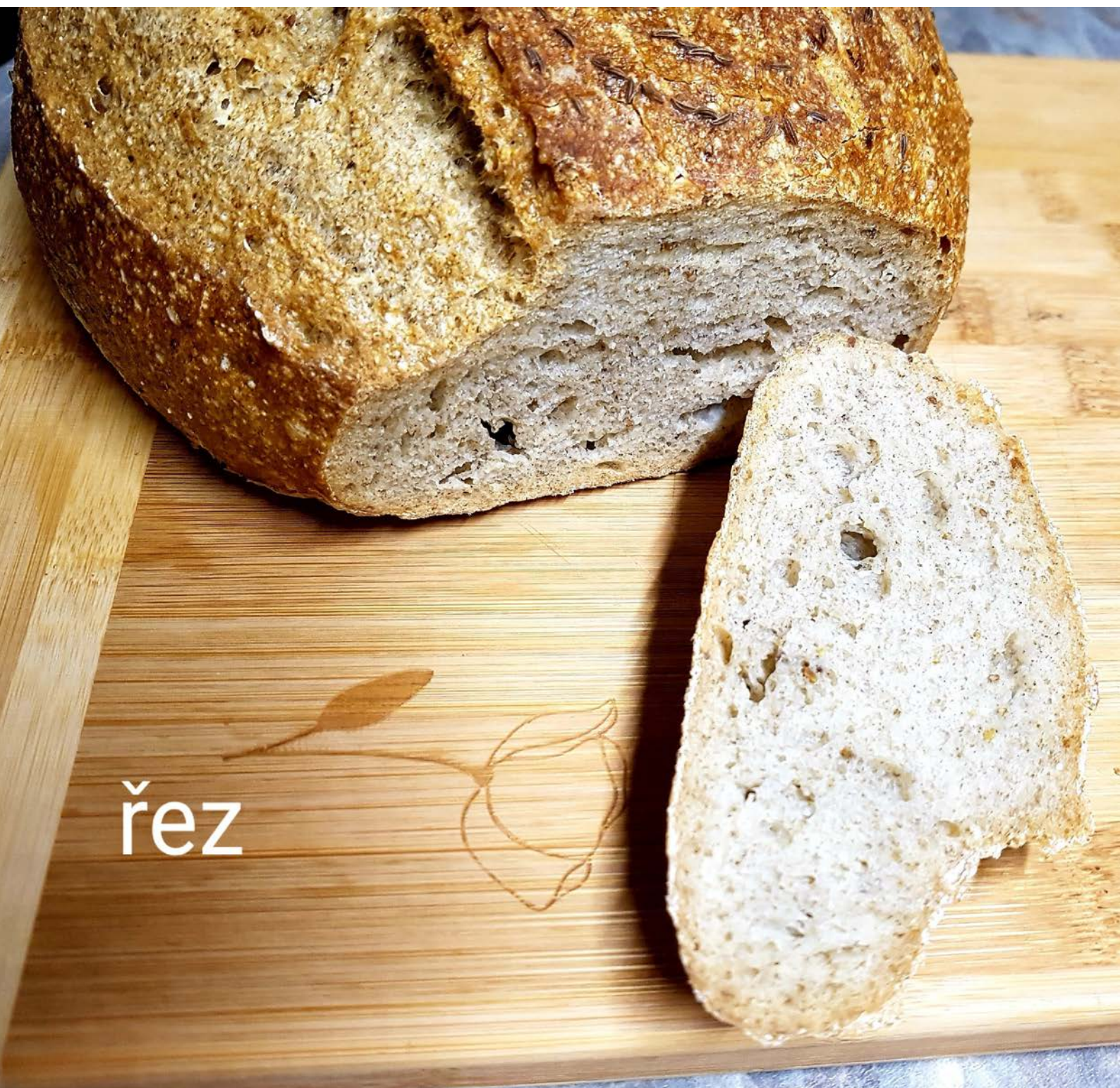
kváskový chléb