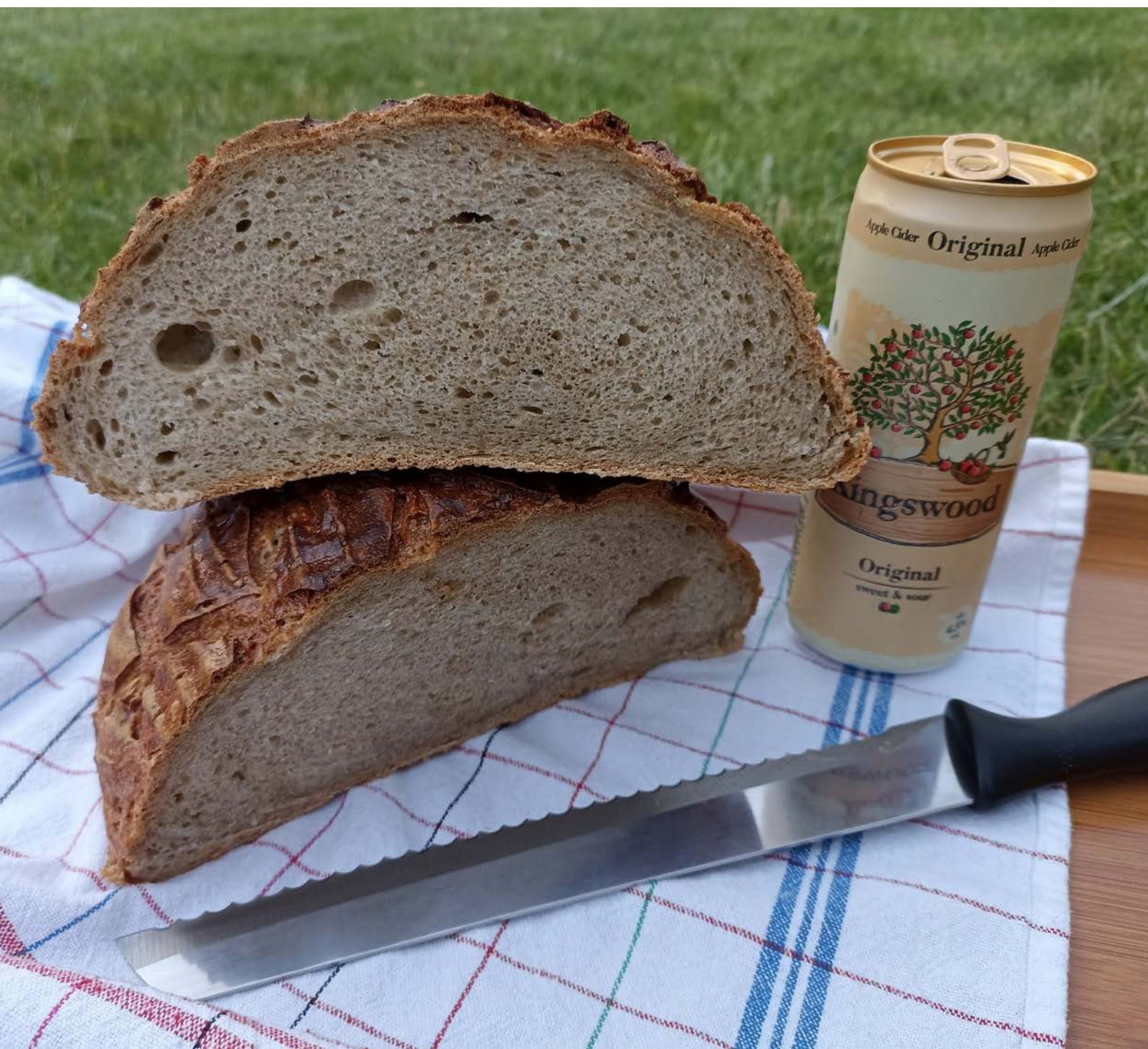
chléb pečený v klasické troubě na volno