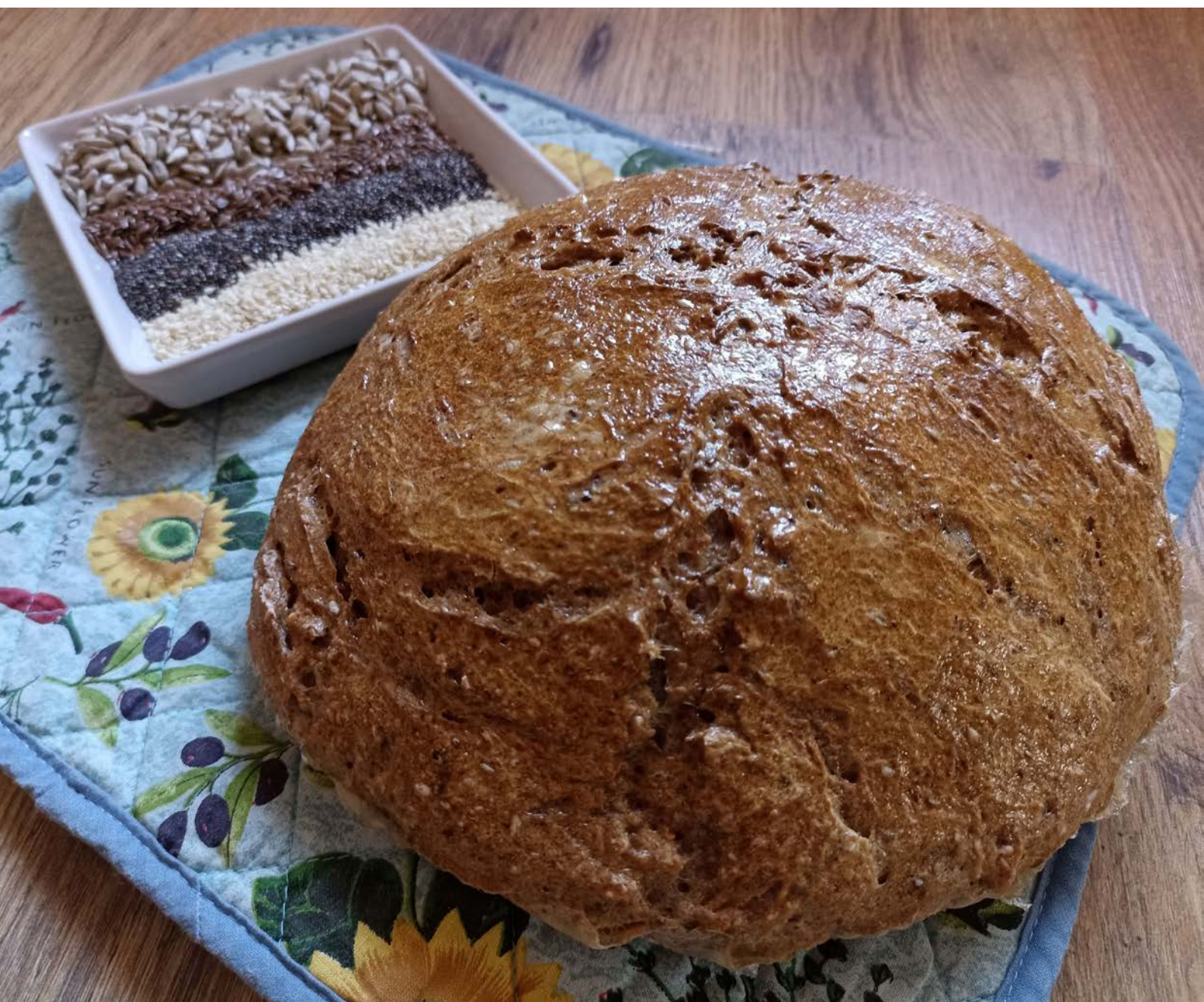
chléb pečený v klasické troubě na volno