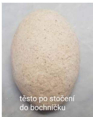
těsto po stočení do bochníčku