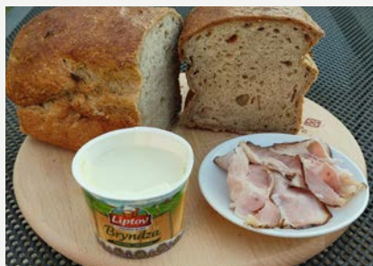
brynzový se slaninou