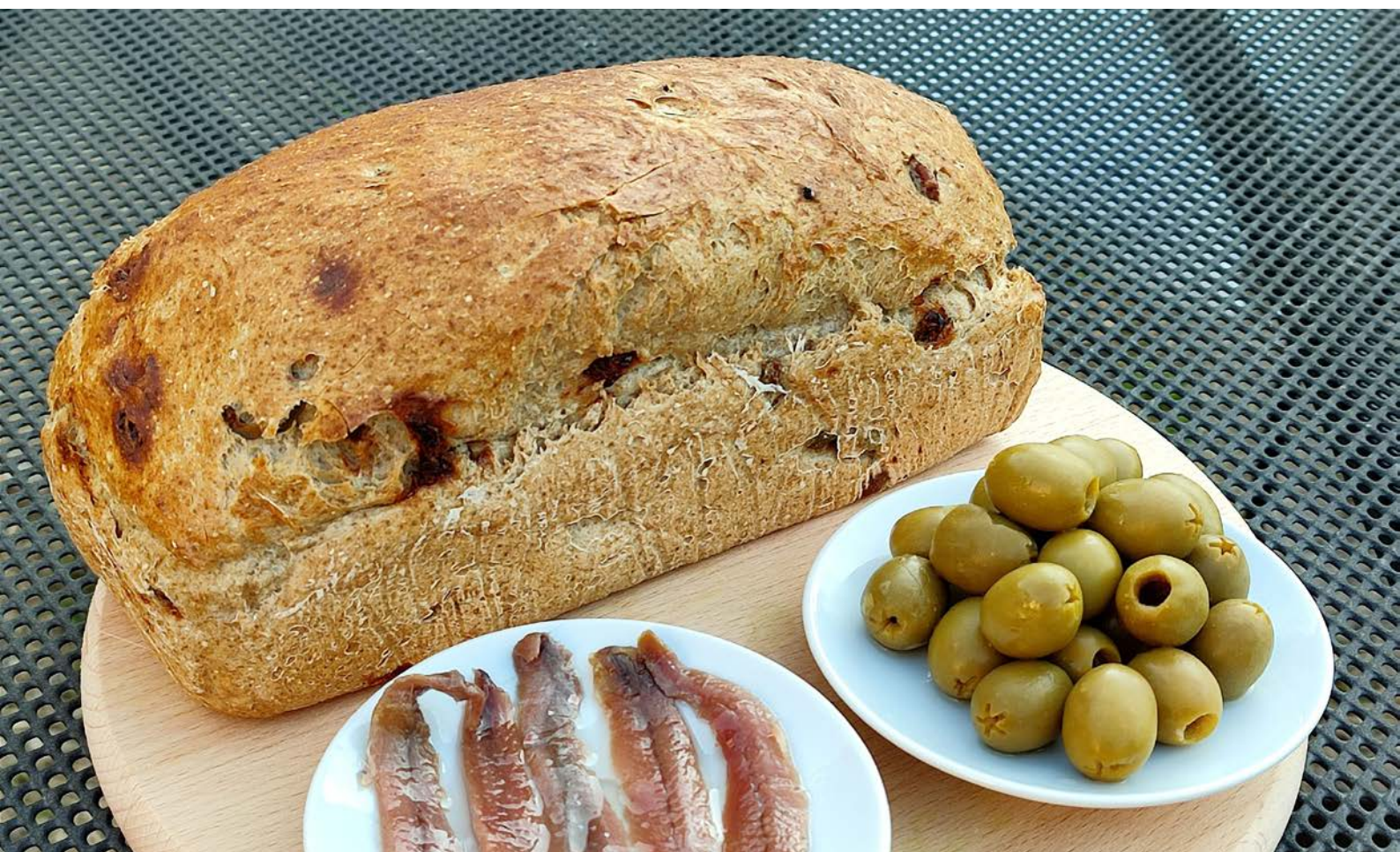
chléb pečený v klasické troubě ve formě, foto: Adveni