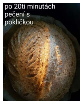
po 20ti minutách pečení s pokličkou

Po 20 minutách troubu vyvětráme, pokličku odstraníme, chléb znovu zastříkneme vodou z rozprašovače, teplotu snížíme na 200 °C a dopékáme ještě cca 40 minut (již bez pokličky). Doba pečení je pouze orientační, je třeba se řídit zkušenostmi s vlastní troubou. Že je chléb hotový, poznáme poklepem na spodní stranu bochníku. Pokud zní dutě, je upečený. Upečený chléb necháme vychladnout na mřížce.