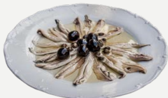
ančovičkový s olivami