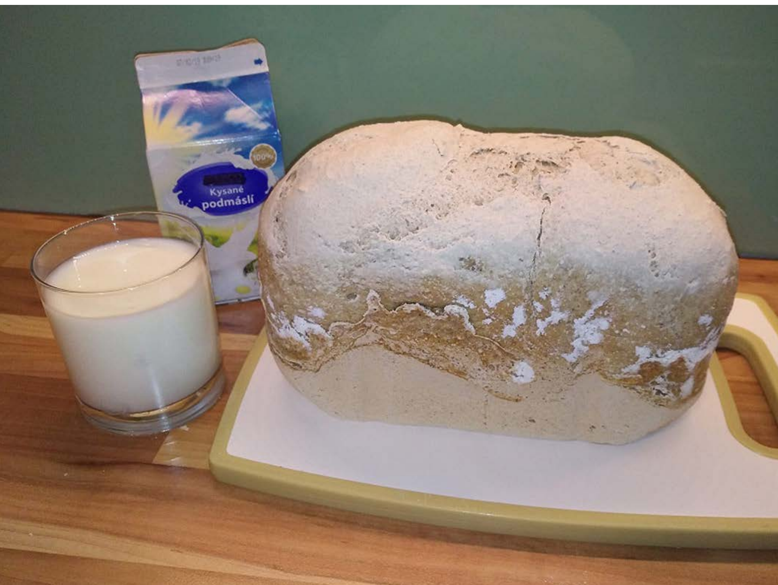
chléb pečený v domácí automatické pekárně