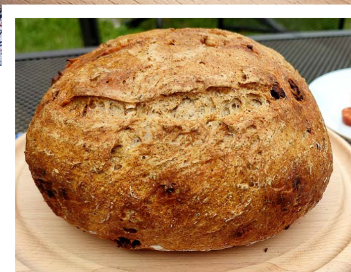
chléb pečený v klasické troubě na volno, foto: Adveni