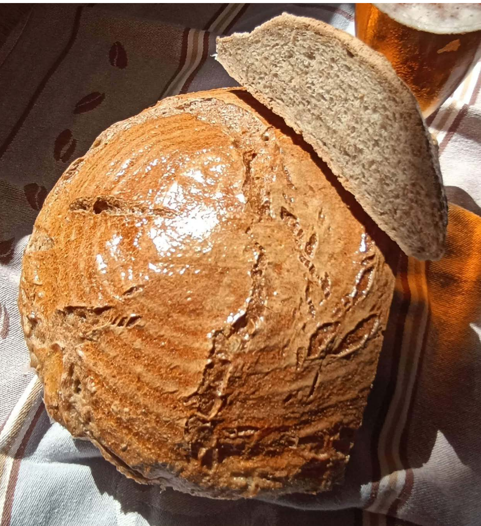
chléb pečený v klasické troubě na volno, foto: Stáňa Hartová