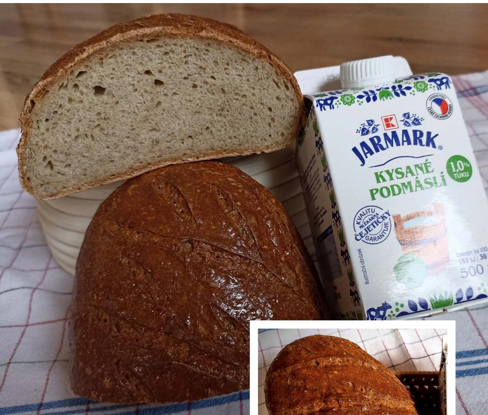
chléb pečený v klasické troubě na volno.