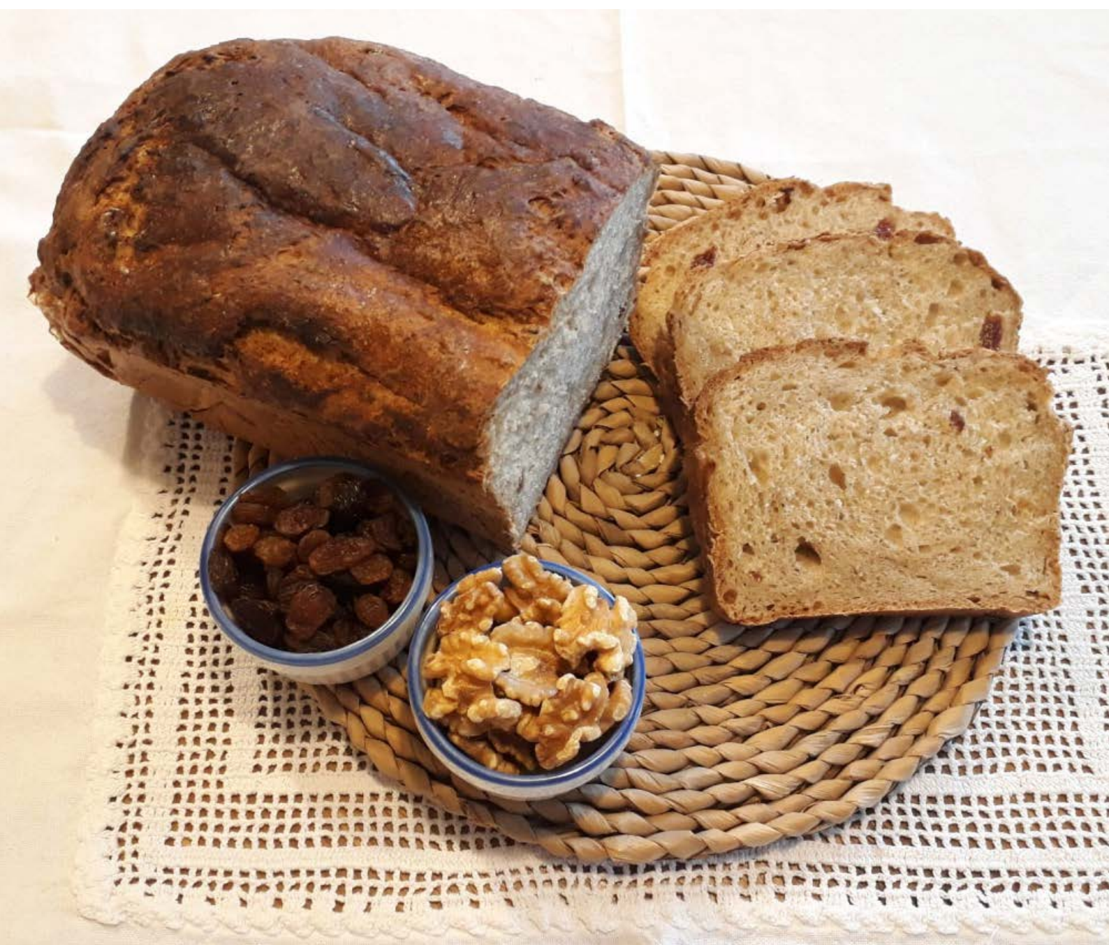
chléb pečený v klasické troubě ve formě