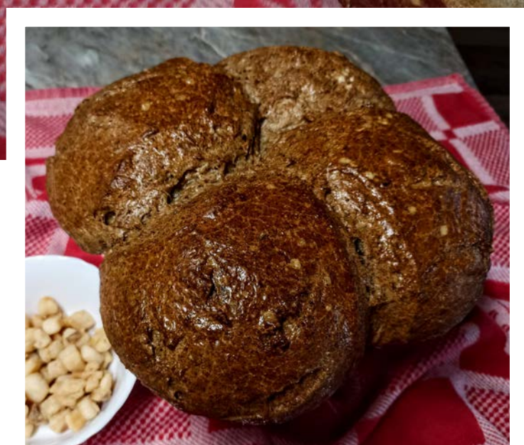
chléb pečený v klasické troubě na volno