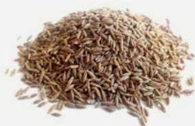
klasický typu „Šumava“