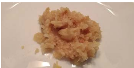
příprava česneku, foto: Adveni