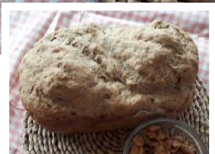
chléb pečený v domácí automatické pekárně