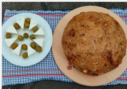
hermelínový s olivami