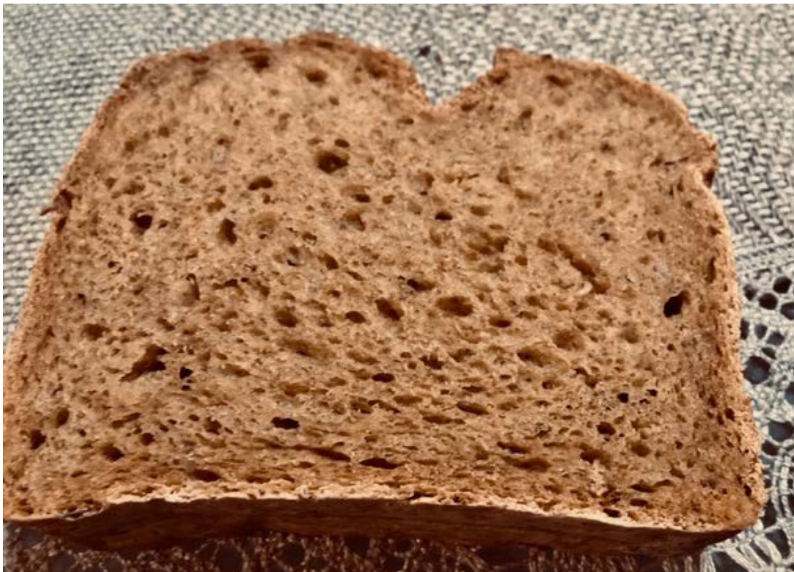
chléb pečený v domácí automatické pekárně