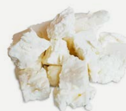
s balkánským sýrem