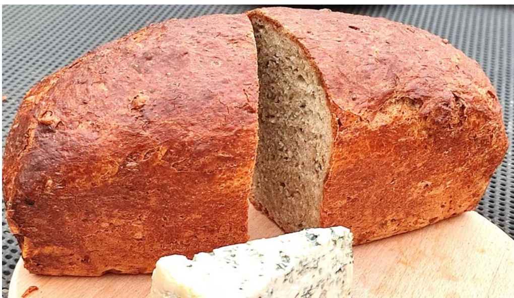
chléb pečený v klasické troubě na volno, foto: Stáňa Hartová