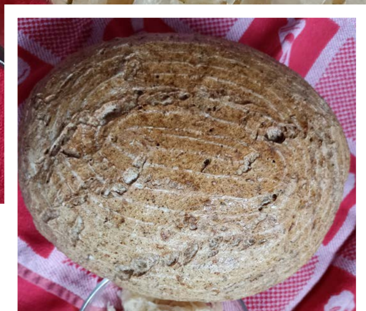
chléb pečený v klasické troubě na volno