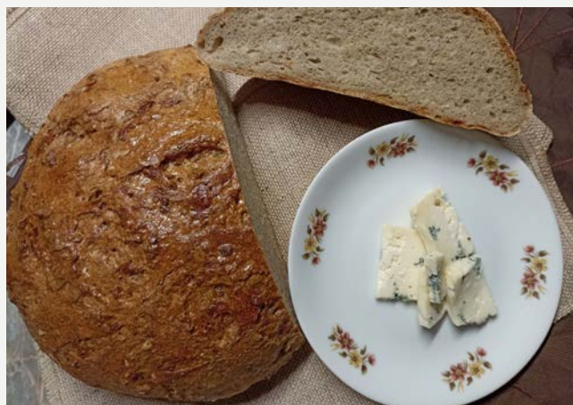
chléb s nivou pečený v klasické troubě volně

V obou případech pečení v klasické troubě zvolíme program horní-dolní ohřev (nikoliv horkovzduch).