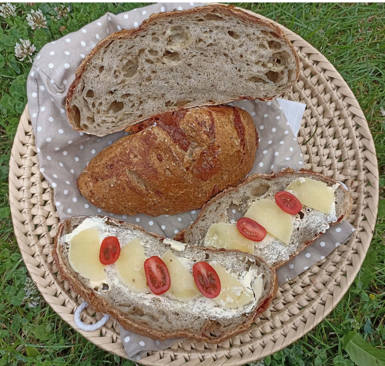
chléb pečený v klasické troubě na volno, foto: Stáňa Hartová