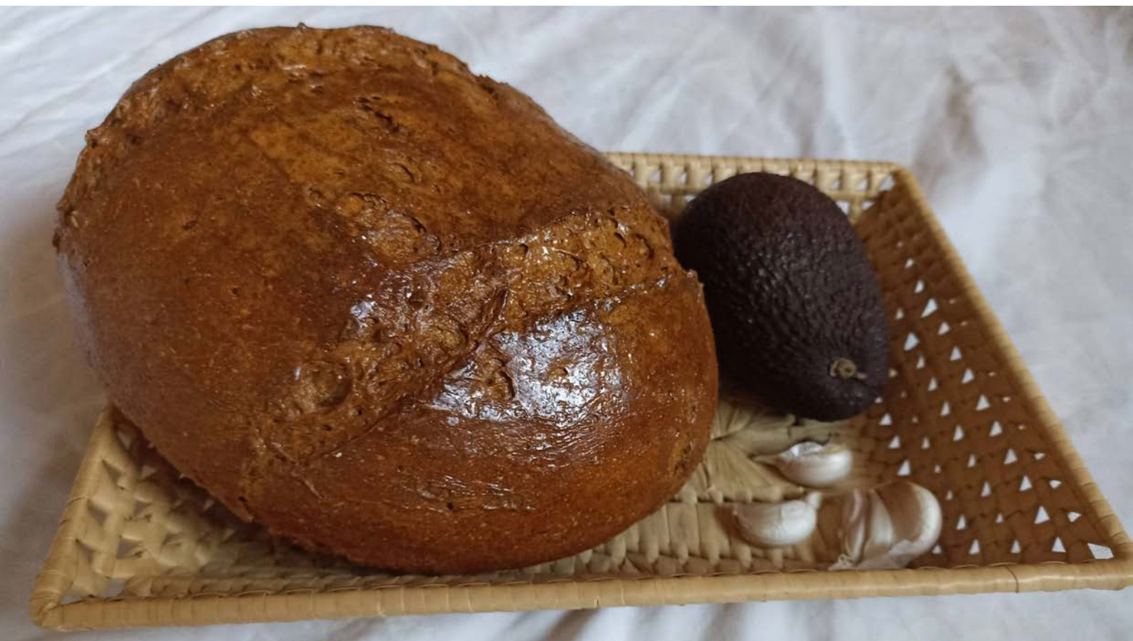
chléb pečený v klasické troubě na volno, foto: Stáňa Hartová