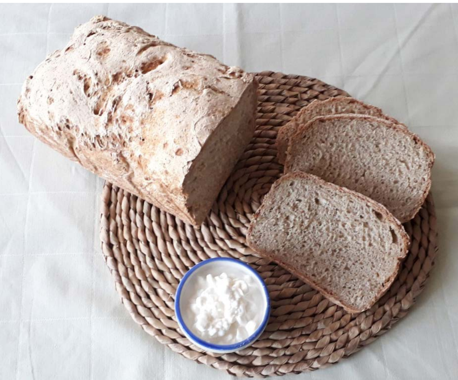
chléb pečený v klasické troubě ve formě, foto: Jana Fialková