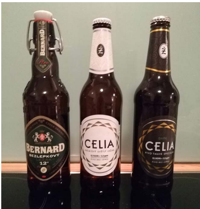
bezlepková piva, foto: Adveni