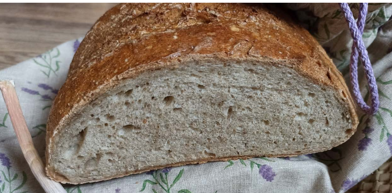
chléb pečený v klasické troubě na volno