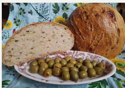
s olivami, parmez. a oreganem