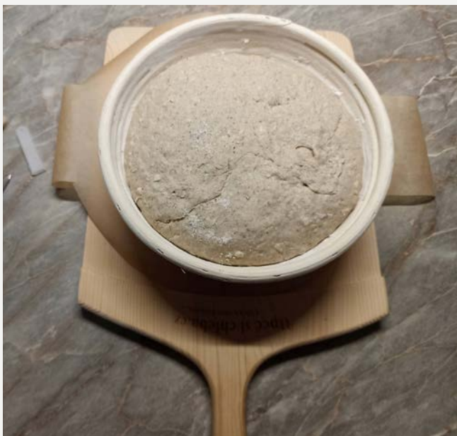
vykynutý chléb v ošátce

Při tomto způsobu pečení těsto zpracujeme (uhněteme), necháme vykynout, pak ho znovu zpracujeme tzv. překládáním, což znamená, že ho ohneme od kraje ke středu, otočíme o 90 stupňů, znovu přeložíme od kraje ke středu, otočíme o 90 stupňů a tento postup několikrát zopakujeme. Následně těsto vytvarujeme do bochánku, který vložíme do škrabem vysypané ošátky a necháme znovu kynout. Máme zde tedy dvojí zpracování těsta, dvojí kynutí. Při pečení volně také navíc potřebujeme ošátku a také tzv. sázečí prkénko, které nám pomůže při vyklopení vykynutého chleba z ošátky. Odměnou je nám ale krásně vlastnoručně vytvarovaný bochník.