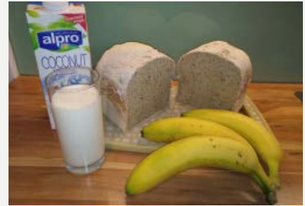
banánový s kokos. nápojem