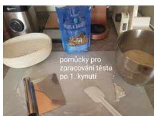
pomůcky pro zpracování těsta po 1. kynutí

3. Odpočinité těsto (po uvedených 3-5 hodinách) vyklopíme na pomoučený vál, kde jej zpracujeme tzv. překládáním. Těsto ohneme od okraje ke středu, otočíme o 90 stupňů, znovu přeložíme od okraje ke středu, otočíme o 90 stupňů. Tento postup několikrát zopakujeme. Nakonec těsto zpracujeme do bochánku, který vložíme do připravené ošatky zakulacenou stranou dolů. Ošatku přikryjeme potravinářskou fólií a těsto v ní necháme kynout v závislosti na okolní teplotě 1-2 hodiny. Těsto musí viditelně zvětšit objem, minimálně o 1/3, a pod lehkým tlakem prstu pružit.