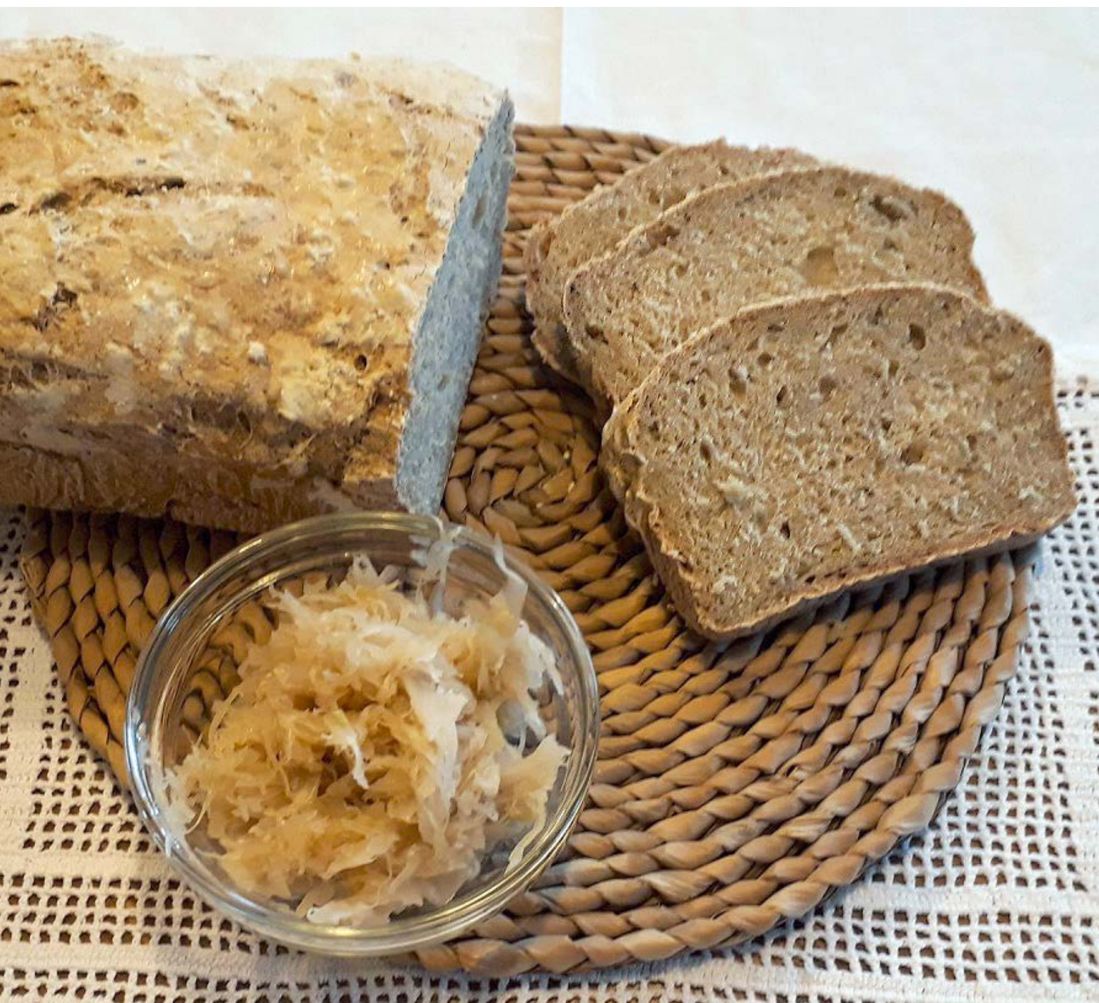
chléb pečený v klasické troubě ve formě, foto: Jana Fialková