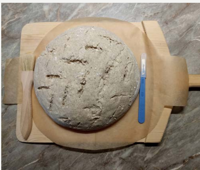
vykynutý chléb z ošátky na pečícím papíře na sázečím prkýnku