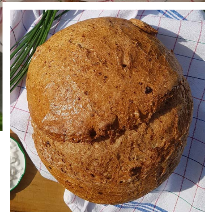
chléb pečený v klasické troubě na volno