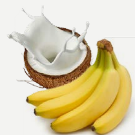
banánový s kokos. nápojem