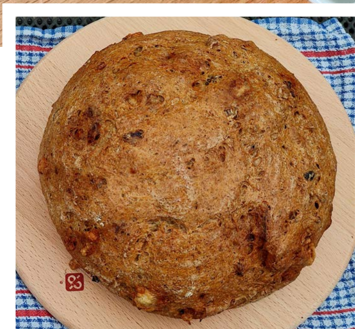
chléb pečený v klasické troubě na volno, foto: Adveni