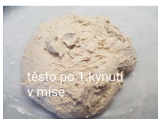
těsto po 1. kynutí v míse