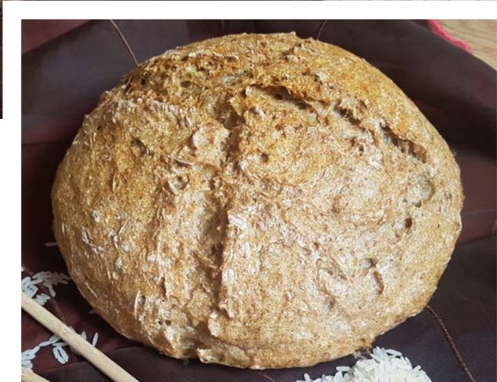
chléb pečený v klasické troubě na volno