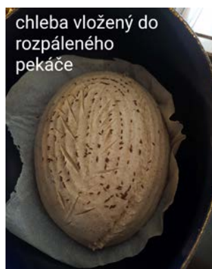
chleba vložený do rozpáleného pekáče

Nakynutý bochník vyklopíme na pečící papír. Zlehka jej ometeme od přebytečného škrobu a uděláme do něj pár zářezů. Bochník pomocí pečícího papíru opatrně vložíme do rozpáleného litinového pekáče, zastříkneme ho důkladně vodou z rozprašovače a pekáč přiklopíme pokličkou. Na maximální teplotu pečeme 20 minut.