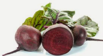
řepový s vlašskými ořechy