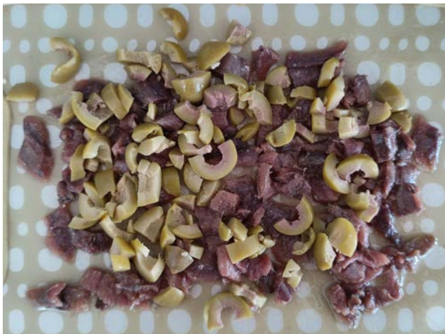
nasekané olivy a nakrájené ančovičky