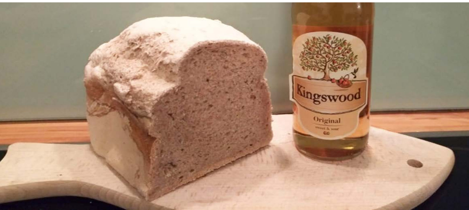
chléb pečený v domácí automatické pekárně, foto: Adveni