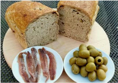
ančovičkový s olivami