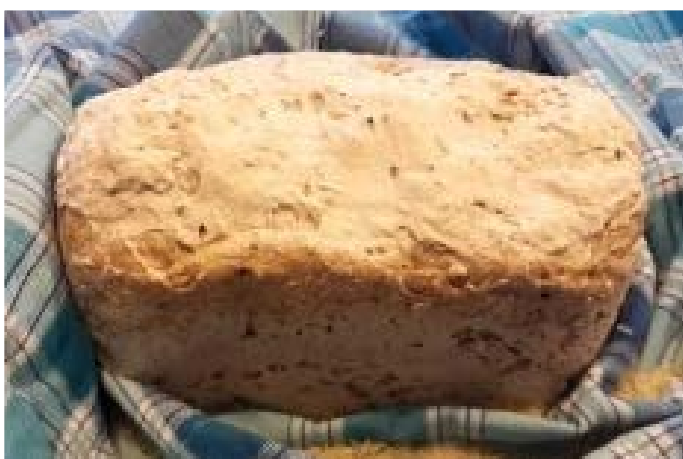
chléb pečený v domácí automatické pekárně