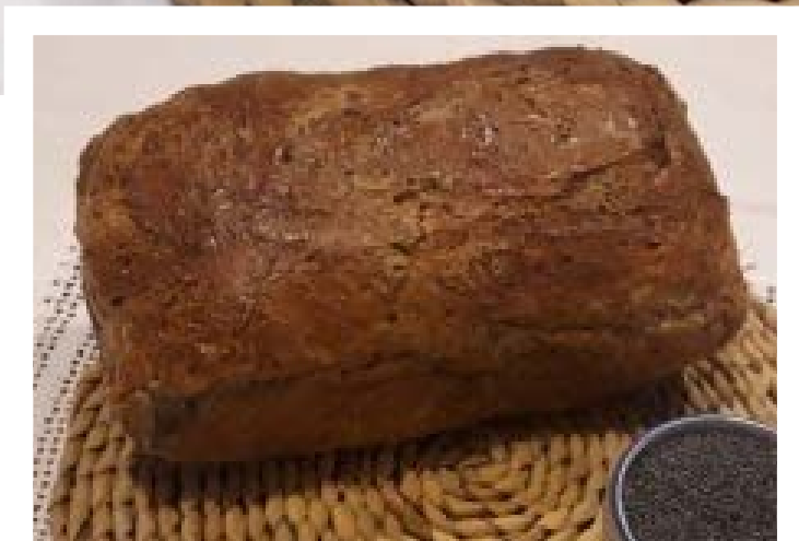
chléb pečený v klasické troubě ve formě