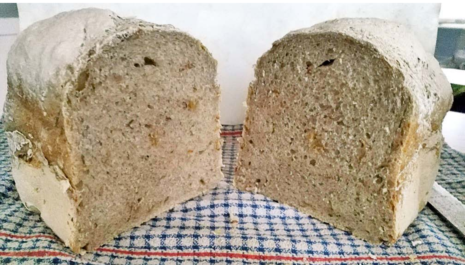
chléb pečený v domácí automatické pekárně