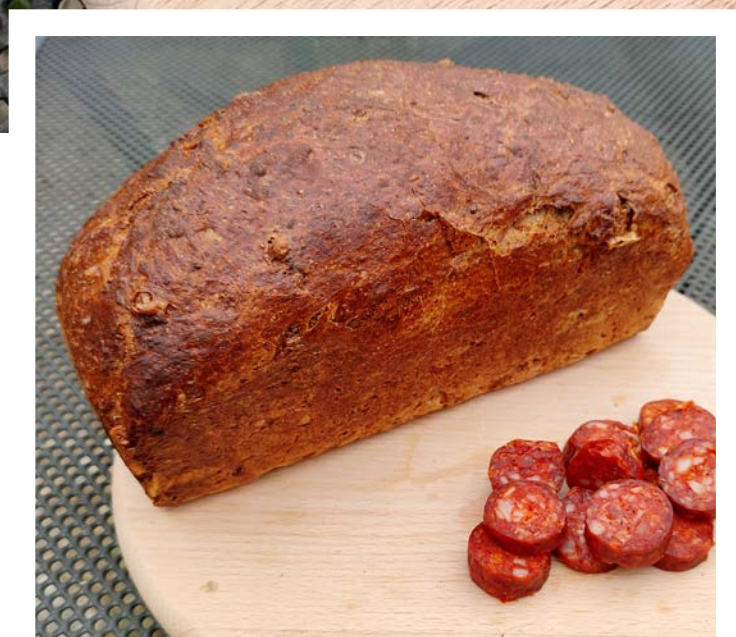
chléb pečený v klasické troubě ve formě