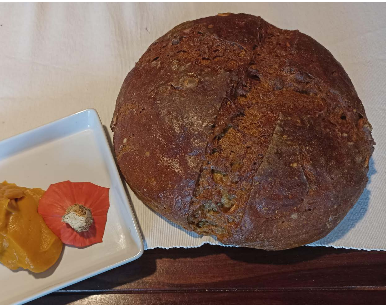
chléb pečený v klasické troubě na volno, foto: Stáňa Hartová