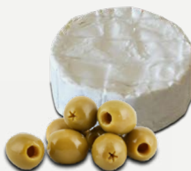
hermelínový s olivami