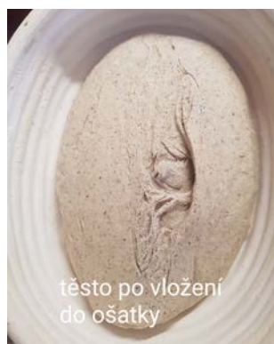
těsto po vložení do ošatky