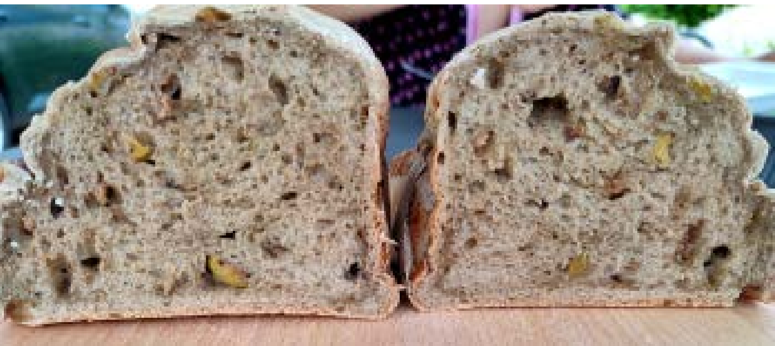
chléb pečený v domácí automatické pekárně