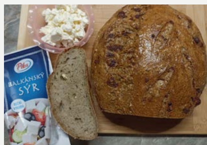
s balkánským sýrem