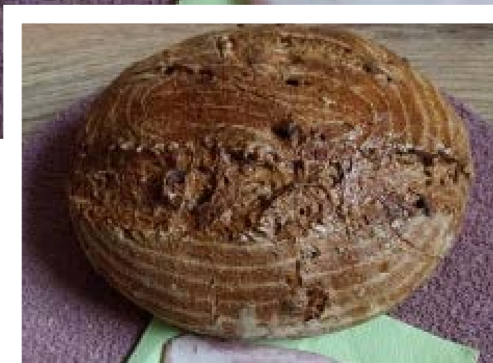
chléb pečený v klasické troubě na volno, foto: Stáňa Hartová