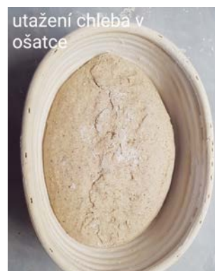
utažení chleba v ošatce