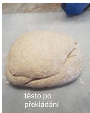
těsto po překládání